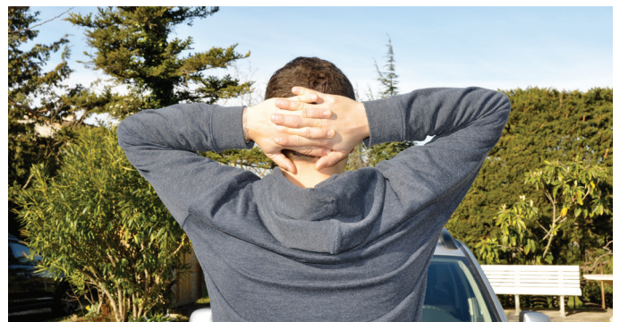
Pour les trapèzes.

⇒ Tendre le bras en avant à l'horizontal. «Casser» le poignet vers l'extérieur (10 secondes, 3 fois de suite sur chaque main).