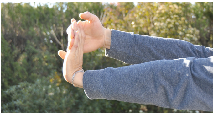
Contre les crampes dans les bras.

► Effectuer quelques exercices, comme ci-dessous :